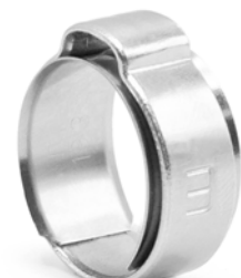
Ein-Ohrschelle mit Innenring Von \varnothing 7 mm bis \varnothing 19mm