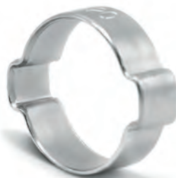
Zwei-Ohrschelle Von \varnothing 5mm bis \varnothing 46mm