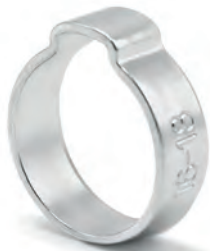
Ein-Ohrschelle Von \varnothing 7mm bis \varnothing 20mm